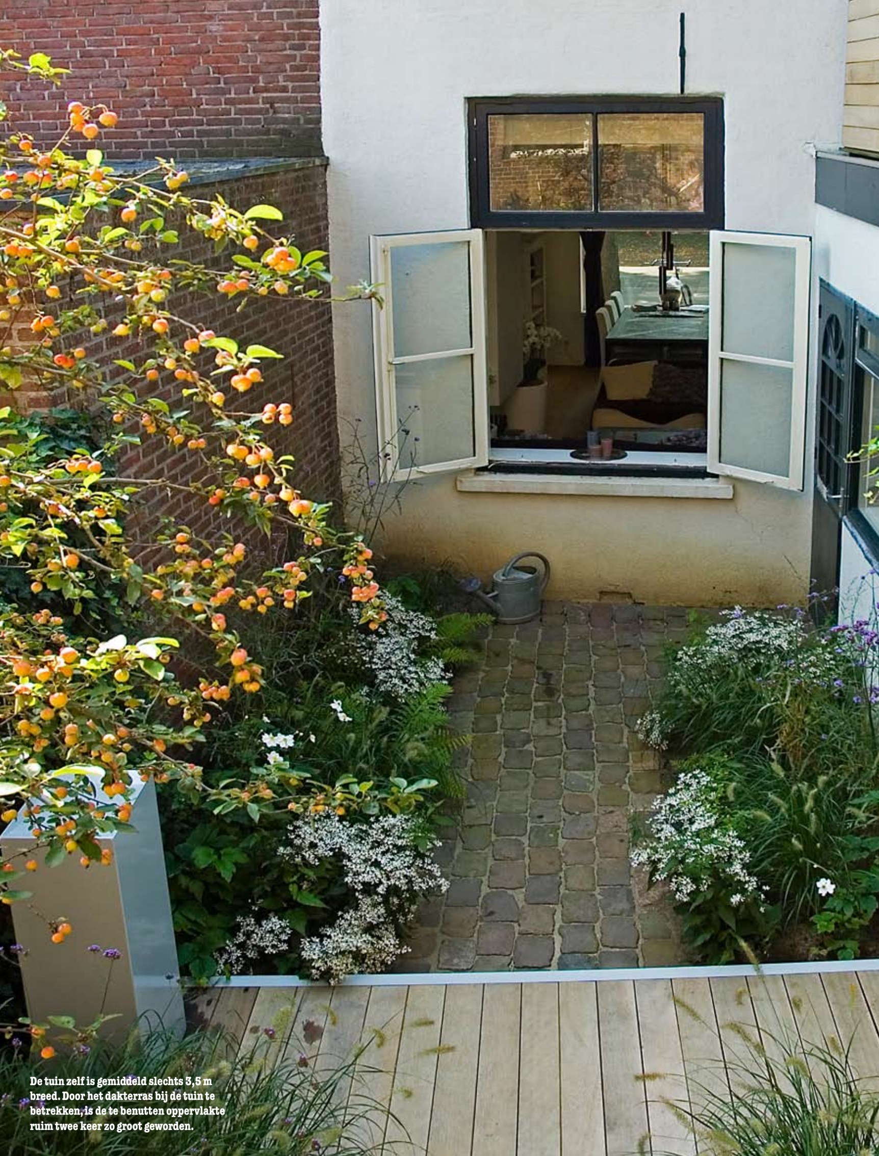
De tuin zelf is gemiddeld slechts 3,5 m breed. Door het dakterras bij de tuin te betrekken, is de te benutten oppervlakte ruim twee keer zo groot geworden.

Tuin en dakterras heeft Nico Kremers zelf aangelegd, met behulp van bevriend tuinontwerper Daan Janssen en enkele andere vrienden.