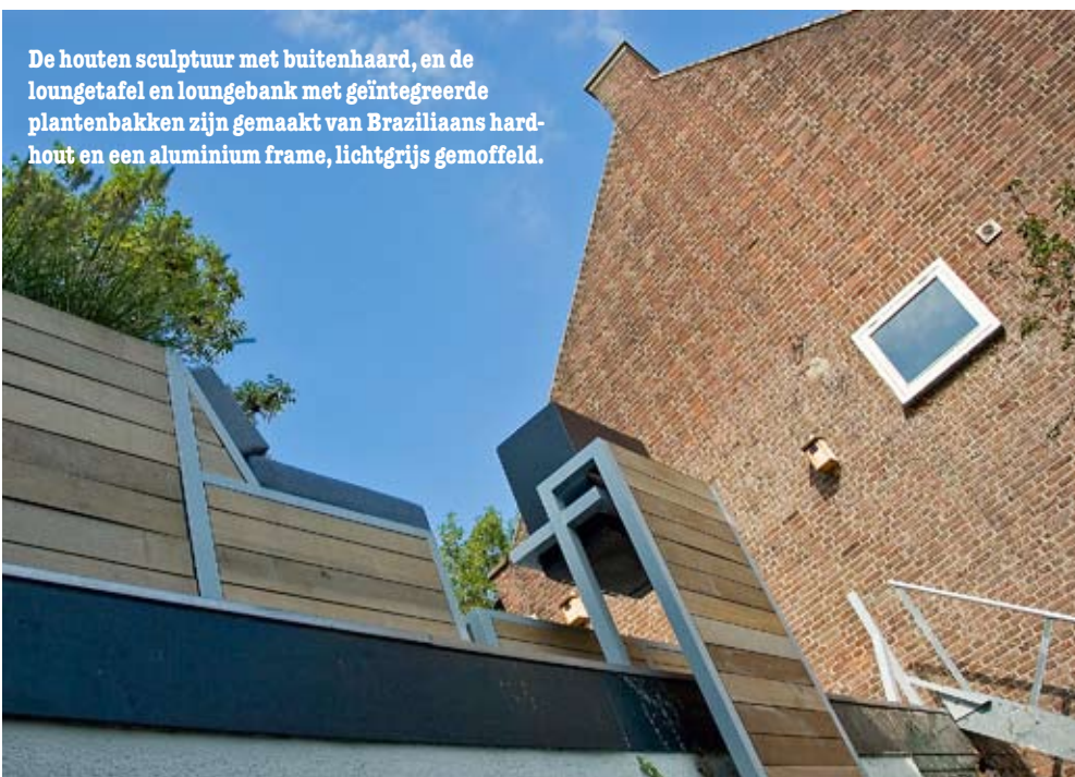
De houten sculptuur met buitenhaard, en de lounge tafel en loungebank met geïntegreerde plantenbakken zijn gemaakt van Braziliaans hardhout en een aluminium frame, lichtgrijs gemoffeld.

Het frame van de loungebank loopt door in de plantenbakken erachter.