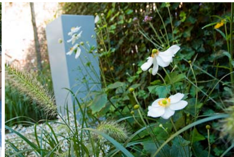
In de tuin is zoveel mogelijk groen toegepast waaronder veel siergrassen en vaste planten, zoals witte herfstanemonen (1).