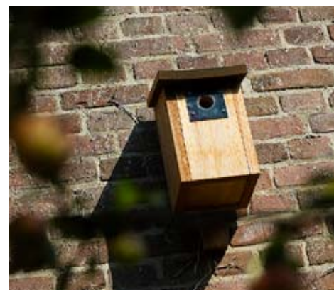
Behalve beplanting die vogels aantrekt zijn in de tuin een vogeldrinkbak, een voederplank en diverse nestkastjes te vinden.

Nico Kremers: ‘In mijn tuin stikt het nu van de vogels. Leuk om vanaf het dakterras te zien hoe ze de appelboom leeg roven!’